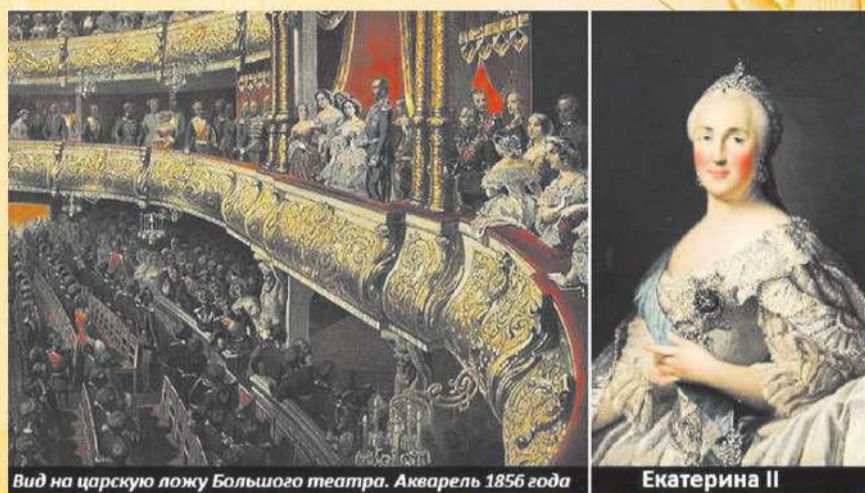
Вид на царскую ложу Большого театра. Акварель 1856 года